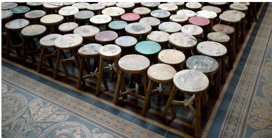
Stools (2014) by Ai Weiwei, Gropius Bau, Berlin