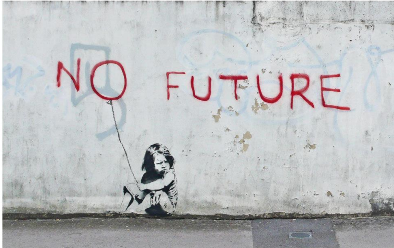
Banksy, London 2010/11