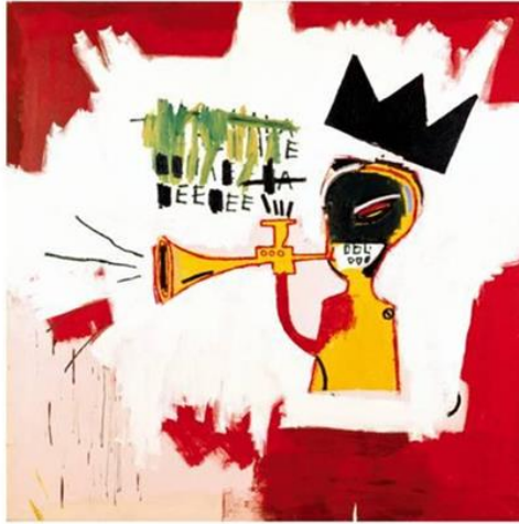
Jean-Michel Basquiat Trumpet 1984