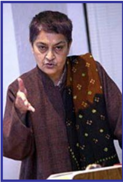
Gayatri Chakravorty Spivak

Romper las reglas y contrarrestar la ignorancia permisiva a través de la crítica persistente y la vigilancia deconstructiva.