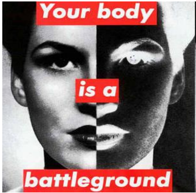
Barbara Kruger, 1989

El cuerpo de los inmigrantes no sólo es el lugar donde confluyen las medidas disciplinarias racializadoras, etnificadoras y fijadoras de género, sino también un lugar donde confluyen las ideas represivas de la sexualidad y los estereotipos.